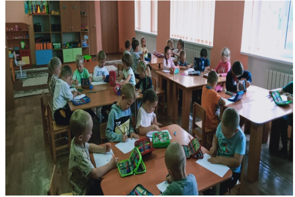
рисунки «моя семья»